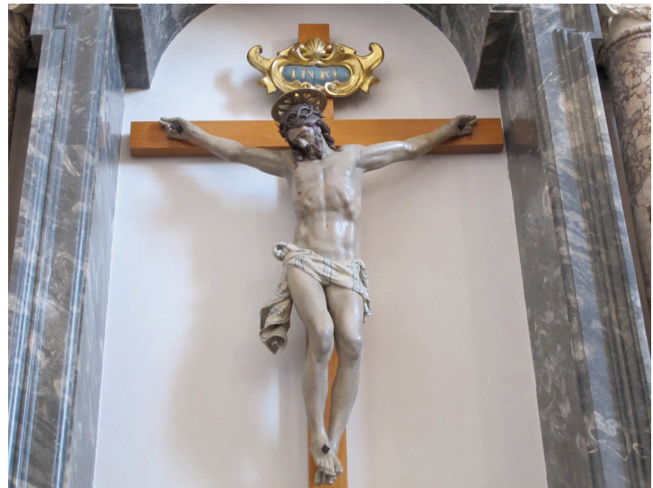
Fig. 95 Crocifisso ligneo prima del restauro (scheda 3a 01) Fig. 96 Crocifisso ligneo dopo l'intervento di restauro (scheda 3a 01)