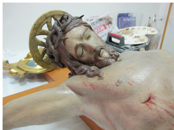
Fig. 97 Partic. Crocifisso ligneo prima del restauro (scheda 3a 01)